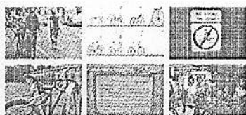
Biciclette in città