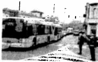
Anche il trasporto pubblico è stato oggetto di attenta osservazione del manager

tadini per procedere poi alla sua rapida realizzazione. Grazie a questo lavoro, inoltre, la città ha ottenuto finanziamenti per attività altrimenti difficilmente realizzabili per la spesa che comportavano, come l'attivazione della ztl (che funzionerà dal 2011), richiesta anche dai commercianti».