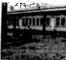
La scuola Fiorana al centro di una grande trasformazione

Traverse a senso unico, parcheggi a spina di pesce, soste, piste ciclabili